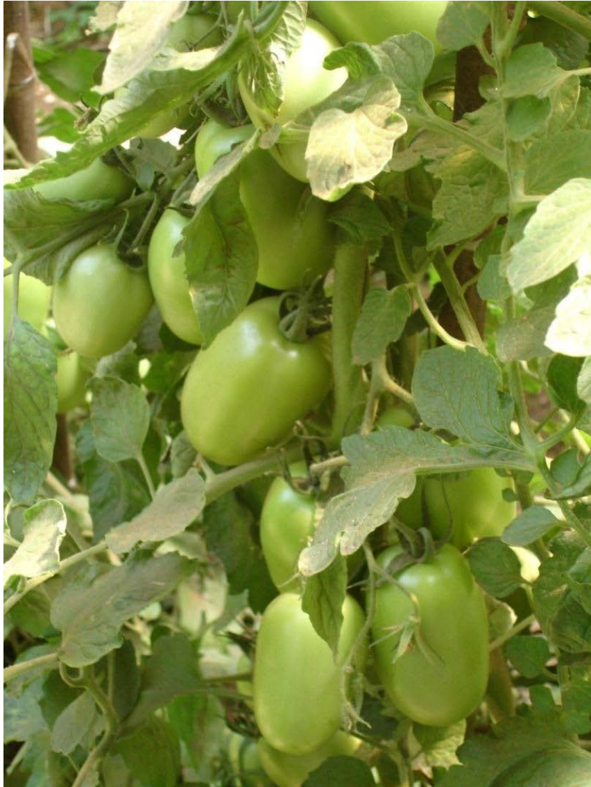
5 días antes del inicio de la cosecha