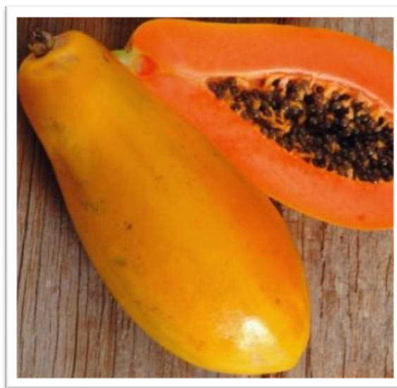
( Carica papaya )