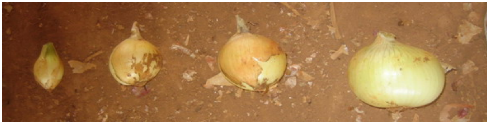
TIP 1 (male)

Luk se klasifikuje prema veličini glavice u sledeće kategorije: Tip 01 – male, Tip 02 – srednje, Tip 03 – velike i Tip 04 – veoma velike glavice. Finansijski efekat proizvođača neposredno zavisi od zastupljenosti pojedinih kategorija u strukturi ukupnog prinosa, posebno kategorije Tip 03 koja je najcenjenija.