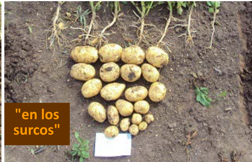
"en los surcos"