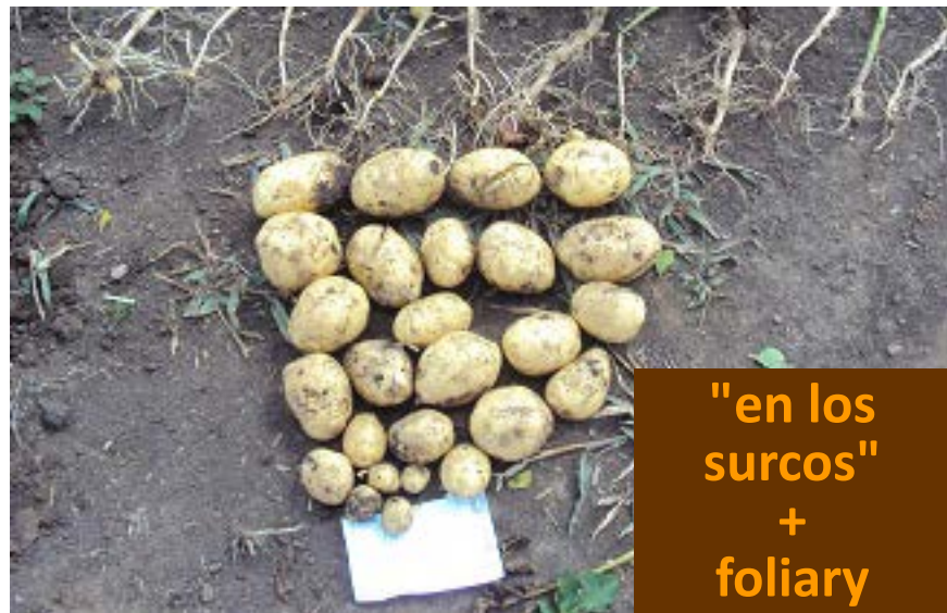
"en los surcos" + foliary