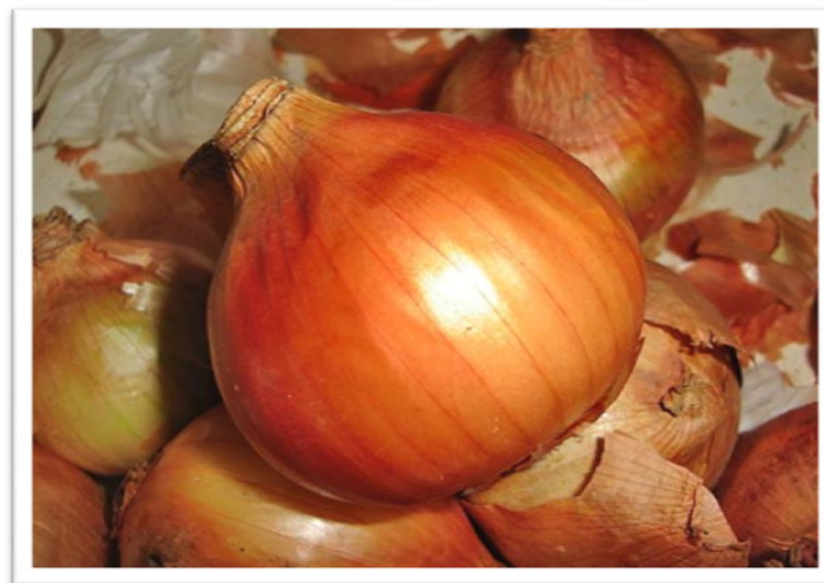
( Allium cepa )