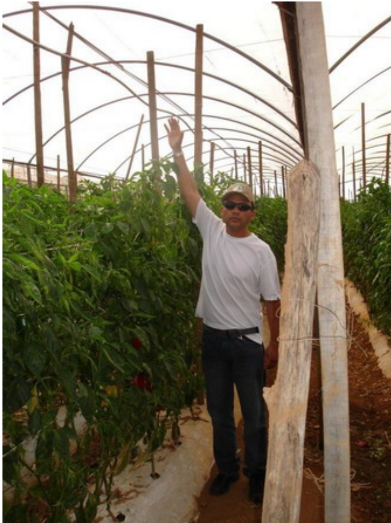
Com Agrostemin Horticultura