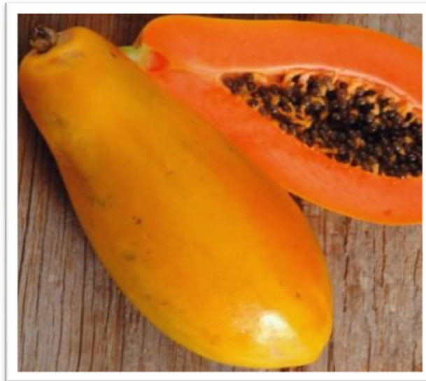
( Carica papaya )